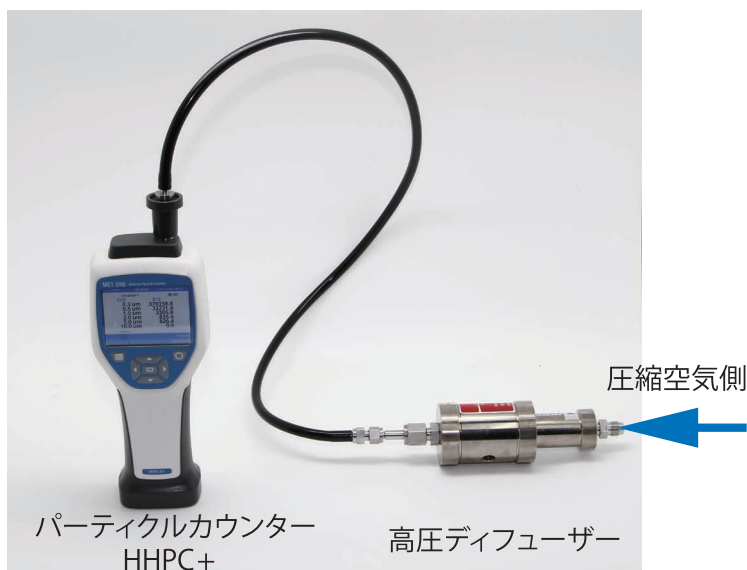
パーティクルカウンター HHPC+