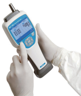
9-5601-22 HHPC 3+

気中パーティクルカウンター MET ONE HHPC+シリーズは、グローバルスタンダードでご使用いただいております。高圧ディフューザーにはHHPC+シリーズとの接続アダプタが付属しています。高圧側はVCR1/4"オス継手となります。